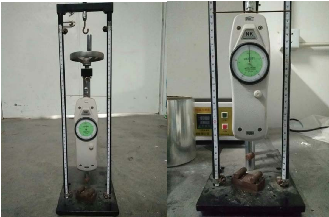
简易弯曲强度测试仪